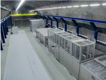
Container in einer Betriebszentrale