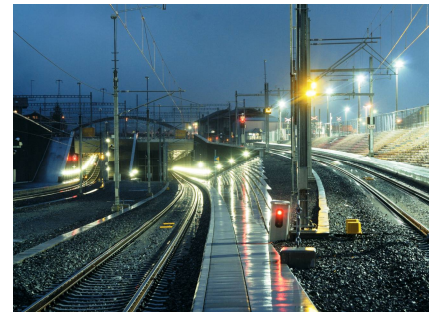
Anschluss Nord während der Testphase Ende 2006