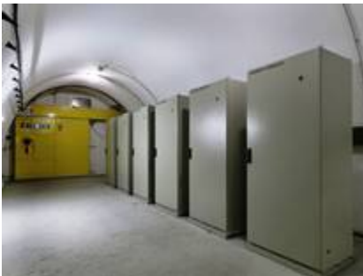
Schränke in einem Querschlag