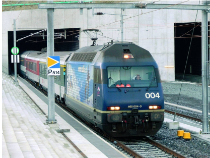
Testzug beim Nordportal