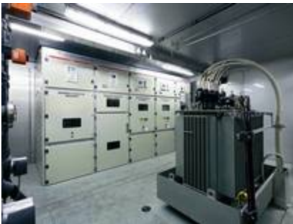
16kV Schaltanlage und Transformator in Container