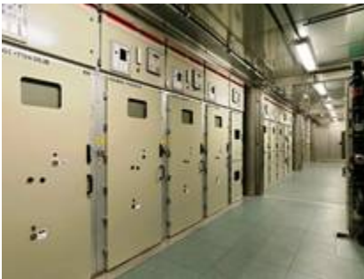
15kV Fahrstrom-Schaltanlage in Container